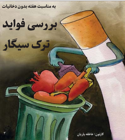
کارتون: عاطفه پاریان