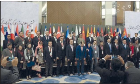
زمینه ی سرمایه گذاری در صنعت گردشگری در ایران فراهم است و برای توسعه گردشگری باید همه دستگاه های مختلف با سازمان میراث فرهنگی، صنایع دستی و گردشگری هماهنگ باشند. اسحاق جهانگیری در نخستین اجلاس وزاری تبریز گفت: ما در تبریز این شهر زیبا به عنوان اعضای گردشگری مجمع گفتگوی همکاری آسیا در هتل لاله مجمع گفت و گوی همکاری های ادامه در صفحه ۸

با حضور وزیر تعاون، کار و رفاه اجتماعی: مجمع آب درمانی، ورزشی و آموزشی صادقی در تبریز افتتاح شد